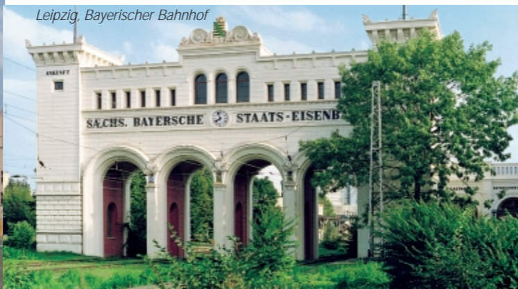
Leipzig, Bayerischer Bahnhof

mit dem eindrucksvollen Cranach-Altar und zu den Häusern von Dr. Martin Luther und Prof. Philipp Melancthon. Die Wittenberger Altstadt: ein einzigartiges Freilichtmuseum, um Weltgeschichte zu erleben. Rückfahrt nach Leipzig. Abendessen im Hotel.