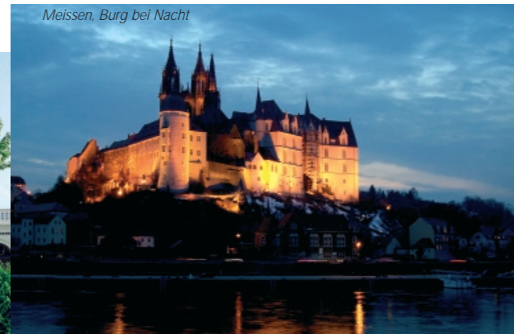
Meissen, Burg bei Nacht

Übernachtungshotel. Nach der Zimmerverteilung Freizeit für eigene Unternehmungen und zum